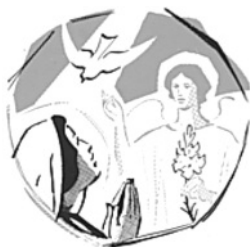
Lc 1:26-38; Isa 7:10-15

María, tú recibiste con gran humildad las nuevas del Angel Gabriel de que tú serías la Madre del Hijo de Dios; obtén para mí igual humildad .